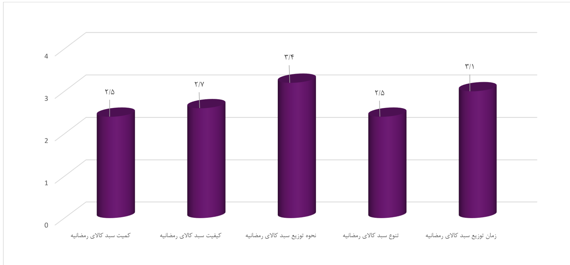
نمودار ۱: میانگین پاسخدهی به هر گویه

نمودار (۱) نشانگر میانگین پاسخی است که به هر گویه براساس طیف لیکرت درخصوص سبدکالای رمضانیه داده شده. چنان که دیده می‌شود بیشترین میانگین پاسخ مربوط به گویه‌ی (۳) و کمترین مربوط به گویه‌ی (۱ و ۴) می‌باشد. نمودار متناظر با آن در ادامه نمایش داده شده است.